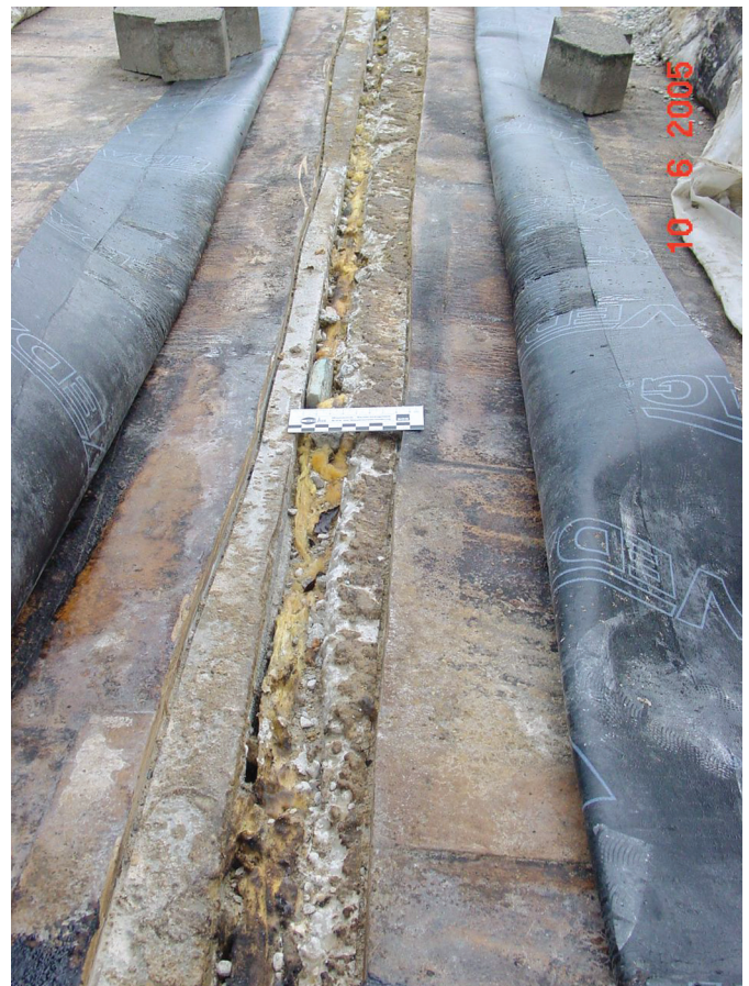
Bild 6. Der Untergrund für die Dehnfuge und Beschichtung ist mangelhaft