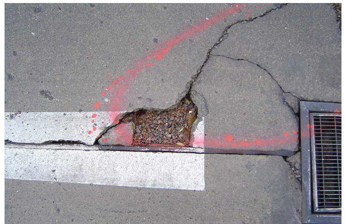
Bild 3. Kantenabplatzungen und Ausbrüche

Betonausbrüche und Abplatzungen in der Fläche sind häufig auf falsche und ungeeignete Betonrezepturen sowie auf Verarbeitungsfehler durch nicht ausreichend auf diese Thematik geschultes Personal zurückzuführen.