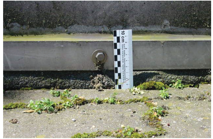
Bild 11. Pflastersteine drücken in die Abdichtung

Für die Dauerhaftigkeit eines Parkdaches sind die ständige Pflege und Wartung mit einem angemessenen Instandhaltungsaufwand unabdingbare Voraussetzung. Bereits bei der Ausschreibung müssen spätere Pflege- und Wartungsarbeiten in Form von Instandhaltungsplänen Berücksichtigung finden. Unbedingt empfehlenswert sind jährliche Inspektionsbegehungen des Parkdach- oder Terrassenobjektes zur Feststellung und Dokumentation des Pflege- und Wartungszustandes. Die Wartungskosten eines optimal geplanten und hergestellten Parkdaches sind sehr