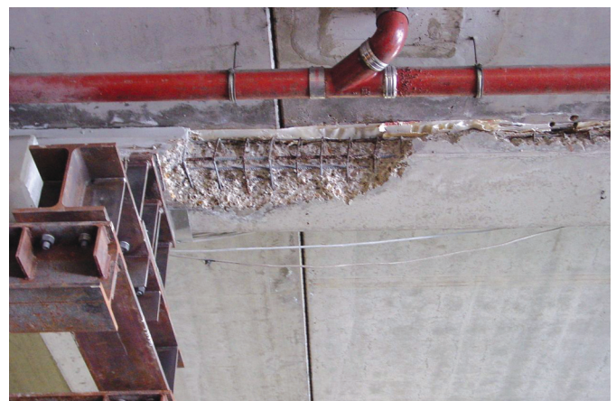
Bild 7. Schwere Betonschäden an tragender Stütze