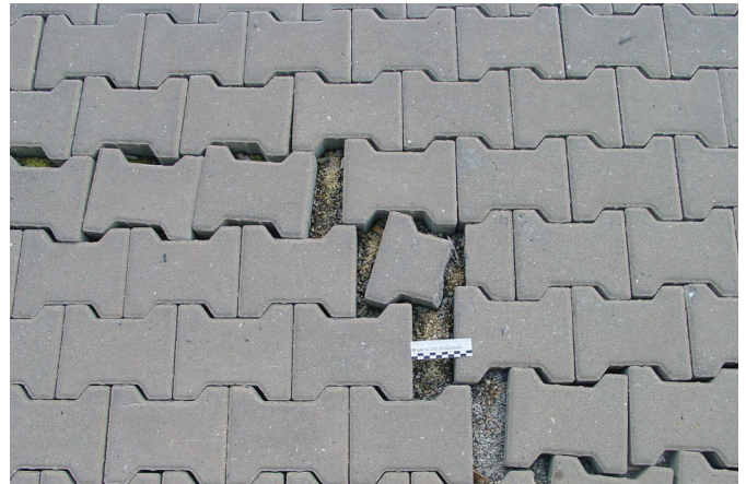
Bild 1. Pflasterverschiebungen durch Fahrverkehr und falsche Bettungsschicht

In diesen Ausbruchstellen sammelt sich das Wasser und führt zu weiteren Schäden, weil es durch die Fugenflanken in den Belag eindringt und im Winter zu weiteren Abplatzungen führt. Gleichzeitig sind es Stolperfallen für Fußgänger und Einkaufswagen rollen nicht mehr störungsfrei.