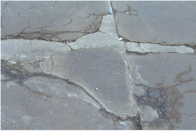
Bild 10. Großflächige Betonschäden

kehrdaches mit einer Kautschukbitumenlage, in welche eine Polymerbitumen-Dachdichtungsbahn eingerollt wird. Die zweite Lage erfolgt im Schweiß- oder Klebeverfahren. So erhält man eine unterlaufsichere Abdichtung.