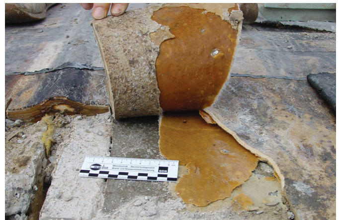
Bild 5. Mangelhafte Beschichtung: Die Lagen lösen sich (links die Dehnfuge)

Fertigbetonplatten können sich besonders in Kurven verschieben, so daß sich die Fugenspalten vergrößern und zu Stolperfallen führen. Unsachgemäße Verlegung und falsche Fugenkreuze begünstigen Verschiebungen und Fahr-/Bremslasten. In Einzelfällen brechen Platten, wenn sie überlastet werden – z. B. durch LKW-Verkehr auf Fahrbahnflächen, die eigentlich nur für PKW-Verkehr ausgelegt sind. Des weiteren wirken bei Transporten mit Gabelstaplern und anderem Hebegerät hohe Kräfte auf die klei-