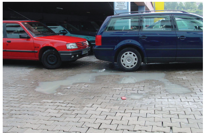
Bild 2. Pfützenbildung durch mangelhaftes Gefälle und falsche Bettungsschicht