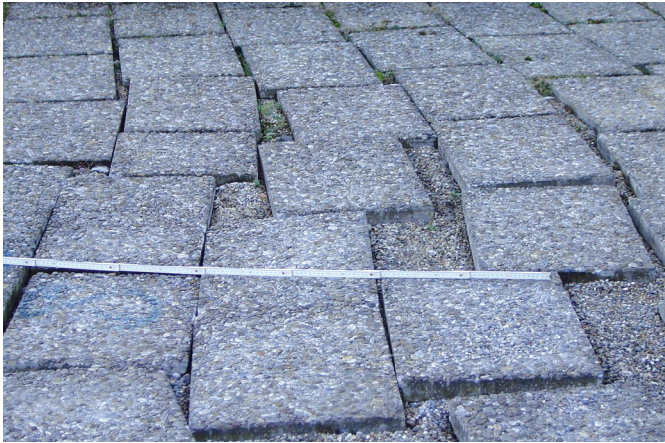
Bild 4. Plattenverschiebungen auf einem Autohaus durch mangelndes Gefälle und falsche Bettungsschicht

Diese Feldgrößen sind wichtig, weil die Fahrbahnplatten die aufgenommene Wärme nicht wie bei einer Straße in den Untergrund weiterleiten können. Hier gibt es keine Bettungsschicht, sondern eine Wärmedämmung, die verhindert, daß die Wärme weiter abgeführt werden kann. Das wird oft nicht beachtet, wenn großformatig betoniert wird. Der Hitzestau im Sommer führt dann zu den schädlichen Ausdehnungen. Das kann nur durch kleinformatige Platten verhindert werden. Bewehrte Ortbetonplatten haben sich in der Praxis bewährt und sind, von qualifizierten Unternehmen hergestellt, sehr langlebig und äußerst wartungsarm.