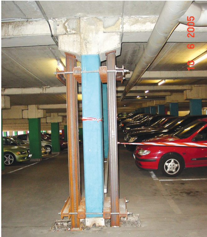
Bild 8. Abfangungen in allen Etagen